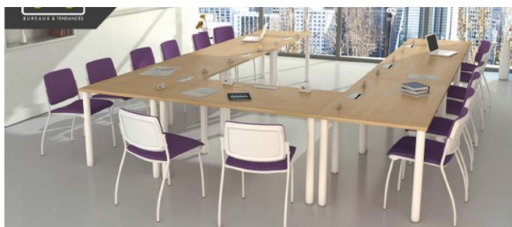
Salon des Iles d'Or (20 places)