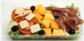
SALADE MELON SERRANO